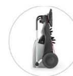
Kompaktowe wymiary – łatwa w przechowywaniu