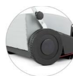
Duże tylne koła