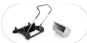
Duży zbiornik na śmieci