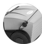
Szybka blokada mechanizmu kierownicy