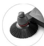
Regulowana boczna szczotka