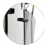
PTFE filtr kartridżowy (klasa filtrowania M)