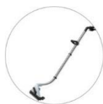
Aluminiowa ssawa natryskowa (opcjonalnie)