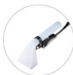
Ręczna ssawa natryskowa