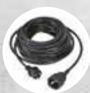
Przewód zasilający o długości 15m