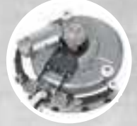
Obracana ssawa (do 270°)